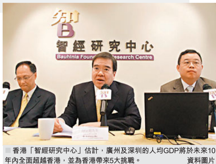
香港「智經研究中心」估計，廣州及深圳的人均GDP將於未來10年內全面超越香港，並為香港帶來5大挑戰。