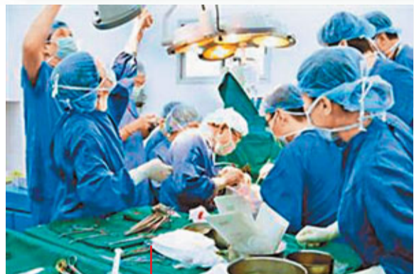
台灣台大醫院誤將1名愛滋感染者捐贈器官用於移植，導致5名接受器官移植病人遭受愛滋感染高風險。