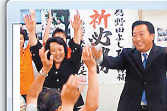
日本執政民主黨新黨魁選舉，財相野田佳彥擊敗呼聲最高的經濟產業大臣海江田萬里當選。