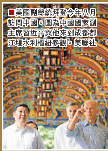
■美國副總統拜登今年八月訪問中國。圖為中國國家副總理王岐山與他來到成都都江堰水利樞紐參觀。

黃平形容，中美關係是越來越重要也越來越複雜。對雙邊關係，其影響也遠遠超出了狹義的雙邊，所以，中美雙方應本着合作精神妥善處理和管控好矛盾和分歧。他強調，中美合則兩利，鬥則俱傷。他相信，從長遠看，中美關係和平與發展的大局，並不會因為一些「小事」和「小人物」的干擾和破壞而發生實質改變，對話與互利仍是中美關係大潮流中的主流。