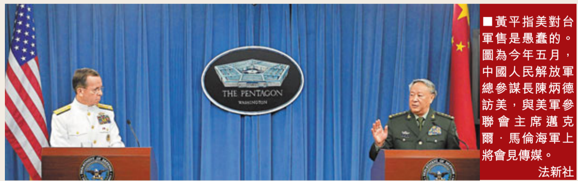
■黃平指美對台軍售是愚蠢的。圖為今年五月，中國人民解放軍總參謀長陳炳德訪美，與美參聯會主席邁克爾·馬倫海軍上將會見傳媒。

黃平：美國在《八一七公報》承諾是逐漸減少並最終停止對台售武，但現在卻是在逐漸增加，還有很多實際上是進攻型武器，這明顯違背了《八一七公報》，作為與中國有正式外交關係的美國，不能這麼來處理這一問題。當然，客觀講，《公報》在美國法律中的約束力，不如《對台關係法》。但真正要解決中美互信問題，就繞不開中美間最敏感的台灣問題，美國首先要停止對台軍售。美國法律可以修改，並非一旦立法就不可再更