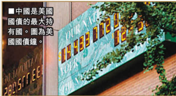
■中國是美國國債的最大持有國。圖為美國國債鐘。

黃平強調，中國經濟現在關鍵是要把自己的事情做好，其中重點是要調整結構，特別要解決好就業和通脹等涉及民生和社會管理的問題。他說，雖然未來美國和全球的經濟形勢仍會對中國有各種各樣的衝擊，但中國的經濟體大，對衝擊的自我承受、消化和修復應對能力強，相信中國一定有能力成功化解風險。