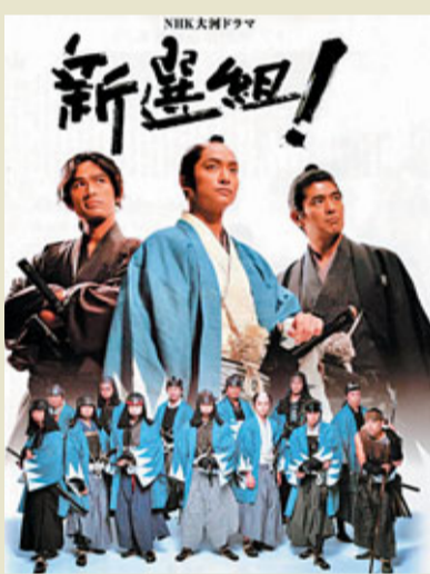
2004年NHK大河劇「新選組」劇照。