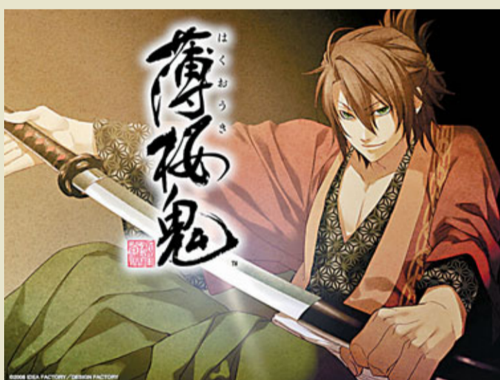
電玩遊戲「薄櫻鬼」的沖田總司。