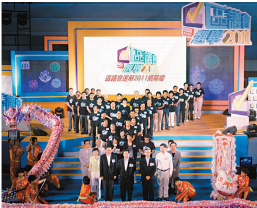
林瑞麟及馮驊等出席區議會選舉揭幕禮，並呼籲選民11月6日投票。

他強調，今年登記選民人數是歷屆最高，達355萬人，年輕人更佔選民比率6成，反映香港年輕一代關心公共事務，實可喜可賀，並呼籲所有選民在11月6日投票，又希望有興趣參選又對香港有承擔的人士報名參選。政制及內地事務局常任秘書長羅智