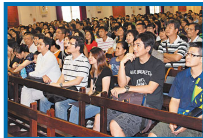
簡介會吸引逾2,500名家長到場取經。

參與簡介會的杜太兒子明年將升小一，她指會加強教導兒子價值觀及禮貌，以爭取入讀心儀校，「希望加強家庭教育，平時有機會與老人家一同吃飯，一定要他先讓人家夾餸。」另簡介會也吸引幼稚園低班、甚至未入學的幼童家長提早了解資訊「未雨綢繆」，潘太兒子現年僅1歲半，但她已連續2年參加簡介會，希望了解收生準則及面試內容，她指每月會花3至4千元，讓兒子參與playgroup以及語言學習班，希望增加未來入讀機會。