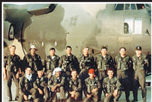
JSOC 1980年拯救美國駐伊朗大使館外交官失敗，直升機墜毀8名成員死亡。網上圖片

JSOC由總統及國防部直接授命，有權對目標人物格殺勿論，更擁有自家情報機構、無人直升機甚至精密衛星網絡。JSOC亦有其「網絡戰士」，曾在2008年9月11日關閉所有收集到的伊斯蘭聖戰分子網站。