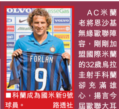
科蘭成為國米新9號。

比起恩沙基，另一位老將加度素就幸運得多。雖然由於上季歐聯16強比賽中對熱刺助教的暴力行為將缺席小組賽的前4場，但加度素依舊得到了阿利基尼青睞，召入AC今次的歐聯大軍名單。