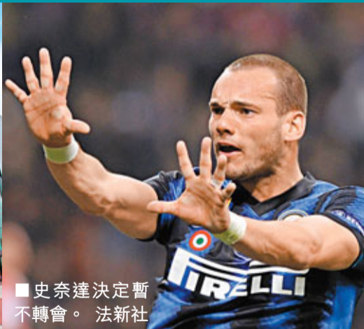
史奈達決定暫不轉會。

員工成本方面，曼聯亦從前一個財年的1852萬飆升至過去一個球季的2205萬，上升幅度達36.4%。