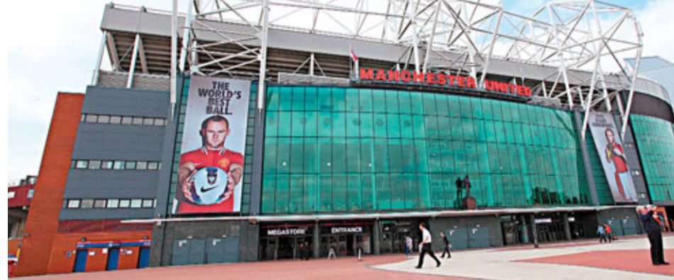
曼聯的奧脫福球場。

英超勁旅曼聯勇奪上屆英超聯冠軍，殺入歐聯決賽，而在財政和商業方面，也取得了理想的成績。紅魔上個財政年度的營業利潤，達到了破紀錄的1.109億英鎊(約14億港元)，3.314億(英鎊，下同)的總收入也創造了驚人的紀錄，比去年同期增加16%，亦是曼聯單個財政年度收入首破3億大關。