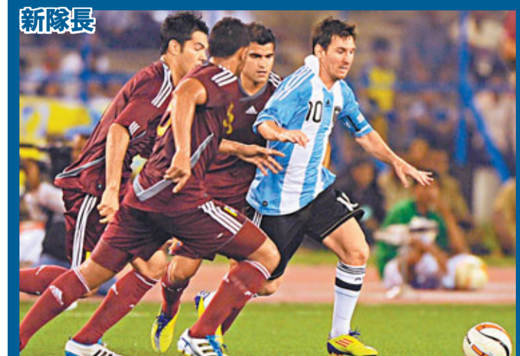
新隊長 阿根廷大軍歷史性在印度獻技，跟委內瑞拉合演了一場熱身賽，結果阿根廷憑奧達文迪下半場的入球小勝1:0。圖為委軍球員合力追截新獲選為隊長的阿根廷王牌球星美斯(右)。