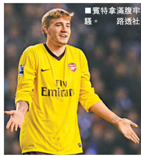
賓特拿滿腹牢騷。