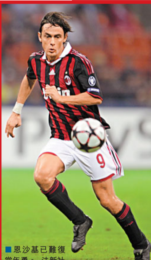
恩沙基已難復當年勇。

新華社羅馬1日體育專電 AC米蘭1日公布了參戰今屆歐洲聯賽冠軍盃的25人大軍名單，其中最令人吃驚的是38歲鋒線老將恩沙基的落選，意味着他將難望再次挑戰個人在歐洲賽的入球紀錄。