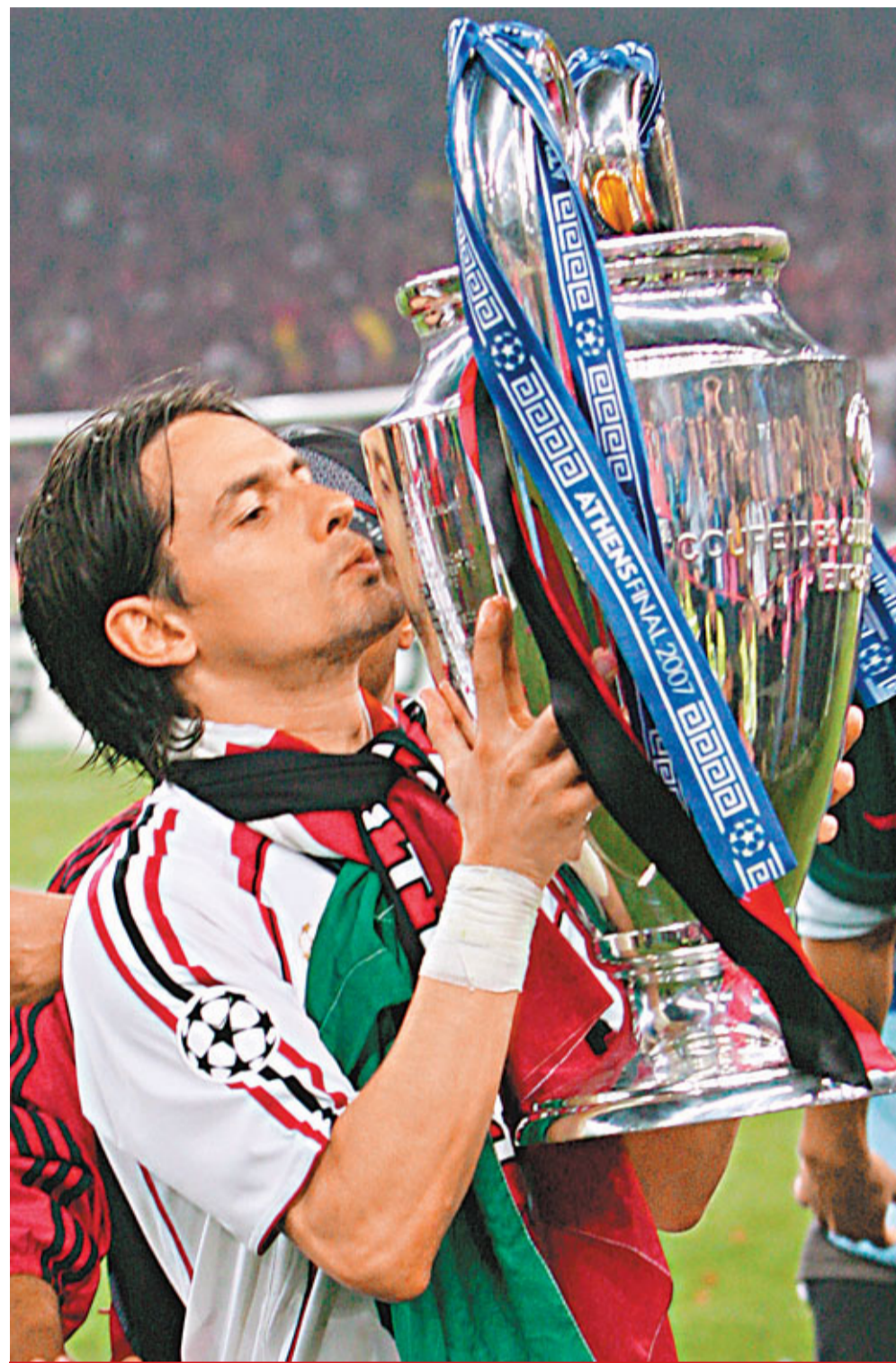
恩沙基四年前協助AC米蘭捧起歐聯獎盃。