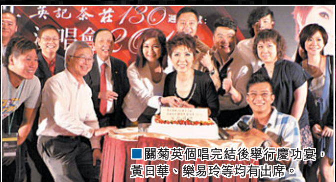
關菊英個唱結束後舉行慶功宴，黃日華、樂易玲等均有出席。