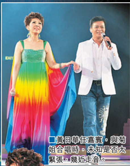
黃日華任嘉賓，與菊姐合唱時，未知是否太緊張，幾近走音。