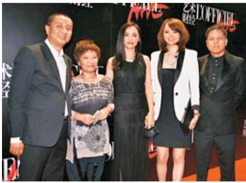
姚晨（圖中）作為嘉賓前來祝賀。以一襲黑色長裙出場的姚晨，引來粉絲一片尖叫。而剛和父母從新西蘭遊玩歸來的她看似心情大好，談及未來工作，姚晨表示已確認出演電視劇《花木蘭》中的花木蘭一角。

姚晨坦言自從《武林外傳》後，就再沒有過男生扮相，此次能演花木蘭，自己都非常開心和期待。早先趙薇憑花木蘭形象獲得多項影后殊榮，被問到是否有壓力時？姚晨笑稱自己看過她的表演，表示並不擔心被比較。姚晨表示：「花木蘭是著名的歷史人物，每個人都會有自己的想像，演好自己的那個就好了。好就好在花木蘭的描述沒有那麼多史料，可能會有比較大的創作空間。」