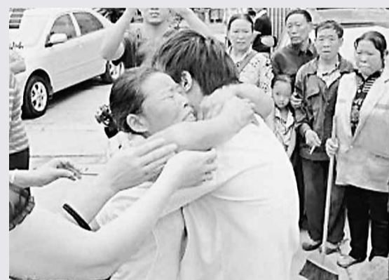
失散13年的母子相見,母親激動而哭。

香港文匯報訊 時隔13年,貴州省桐梓縣婁山關鎮的屠某夫婦近日終於找到失蹤的兒子。據稱當年兒子離家出走時才9歲,如今