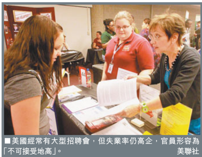
美國經常有大型招聘會，但失業率仍高企，官員形容為「不可接受地高」。