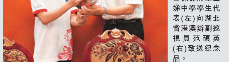
■保良局董玉娣中學學生代表（左）向湖北省港澳辦副巡視員范碩英（右）致送紀念品。