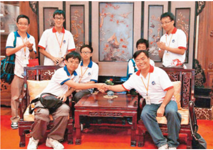
■師生在釣魚台國賓館扮演領導人會面。