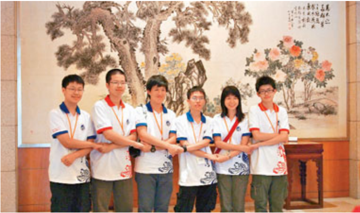
■觀塘瑪利諾書院師生重現六方會談領導人經典握手畫面。