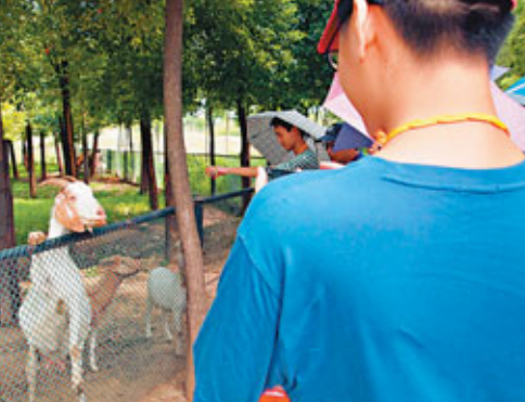
■看到一批香港師生來到武漢的農耕年華，欄內的山羊好奇地探出腦袋。