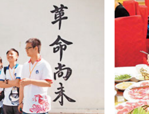
■看到「革命尚未成功」這一句經典名言，怎能不留影？

洪磊大方分享，表示外界非常重視中國的聲音，自己亦感到肩負重要的使命，一直以小心謹慎的態度應對。他指，中國作為正確崛起的國家，令他感到做這個發言人工作很有尊嚴和地位，雖然艱難，但也希望做出好成績為國家貢獻。