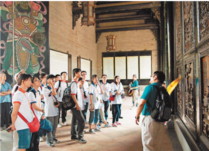
■導遊向學生講解廣州陳家祠的精緻雕刻。