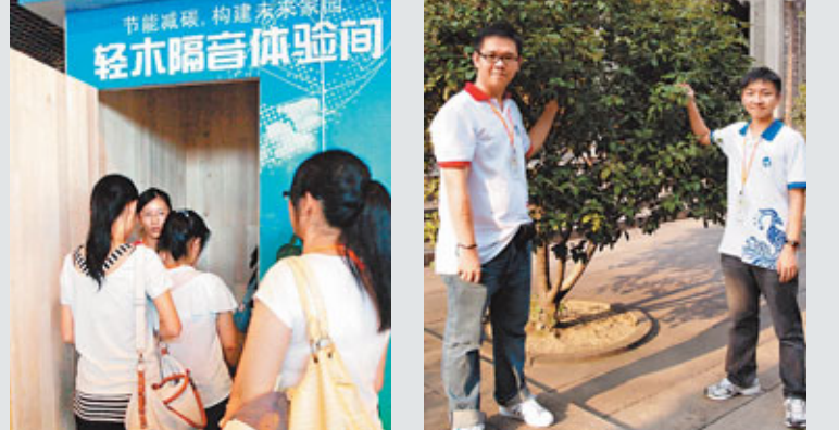
■學生在武漢東湖高新技術開發區的華大基因公司，體驗以「輕木」建造的小屋。