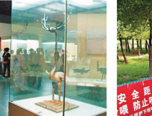
■湖北省博物館內，學生掏出相機拍下眼前的國寶級文物《銅鹿角立鶴》。