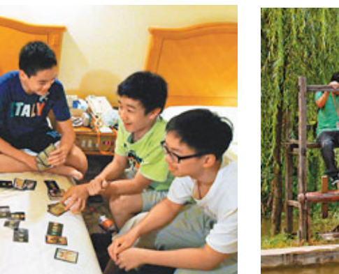
■年輕一代精力充沛，晚上回到酒店後又聚在一起玩遊戲。