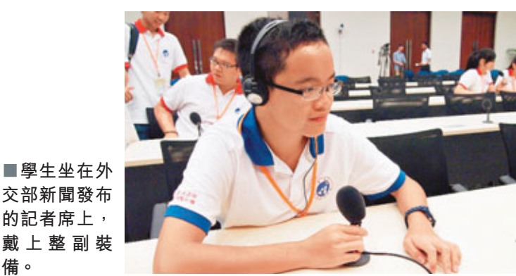
■學生坐在外交部新聞發布的記者席上，戴上副裝備。