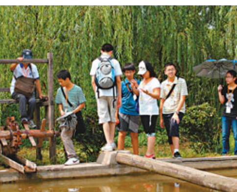
■訪問團師生踴躍嘗試各種水利工具。