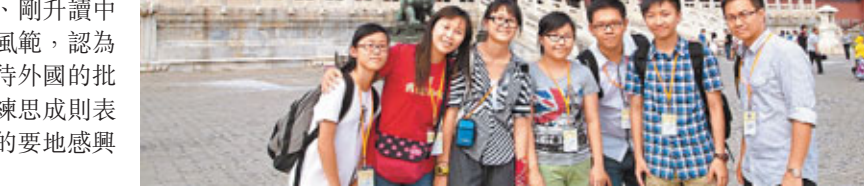
■進宮了！師生在故宮留影。