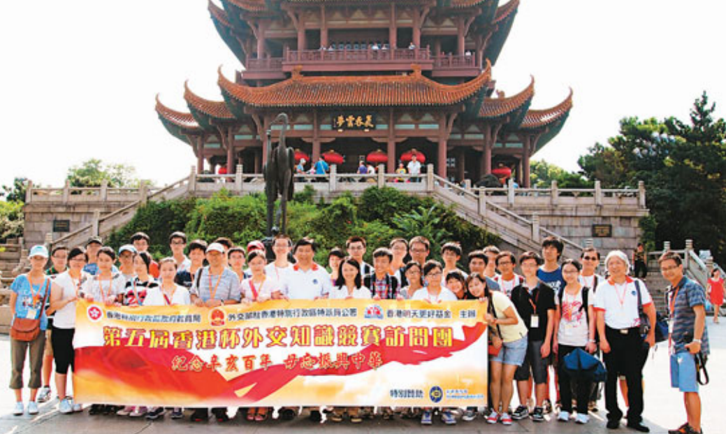
■黃鶴樓是1985年新建的，到武漢怎能不這個地標？