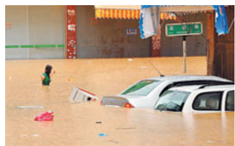
莆田主城区汪洋一片。

香港文匯報訊(記者 葉臻瑜、黃珊、田甜 綜合報導)受颱風「南瑪都」殘留雲系影響,福建莆田市境內1日突降特大暴雨,並引發該市嚴重的洪澇、山洪、滑坡等災害。