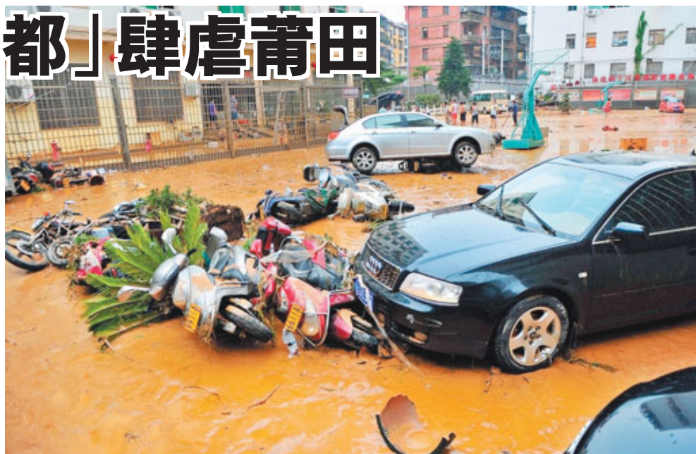
福建省莆田市農行停車場裡的車輛被內澇洪水淹沒。

中新社的報道指出,截至1日14時初步統計,莆田市共發生地質災害27處,倒塌房屋110戶305間,受災民眾達37.3萬人,因災死亡2人,失蹤6人。其中,因塌房死亡1人;在解救遇險民眾途中,衝鋒舟被風浪傾翻,導致1人死亡、6人失蹤。