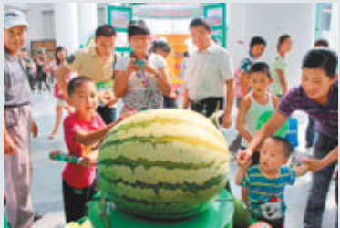
■甘南縣生產的特大西瓜。

與往屆相比，本屆綠博會呈現「六多」：綠色食品參展比重多。本屆綠博會共有620個展位，其中綠色食品展位達到509個，佔比82%；參展國家和外地企業多。有北京、上海、雲南等25個省（市、自治區）以及法國、越南、老撾等13個國家和地區的340家企業以及本地135家企業參會參展。參展品種和精品包裝產品多。參展的有機、綠色、無公害食品共29大類、2383個品種。大企名企多。法國卡斯特莊園葡萄酒、韓國多農株式會社等15家企業參會參展，比上屆增加2個。自主產品品牌多。有來自齊齊哈爾市985種產品參展，其中，有機綠色食品標誌產品達217種、400多個產品，比上屆增長15%。經銷商參會數量多。50家經銷商參會，比上屆增長25%。