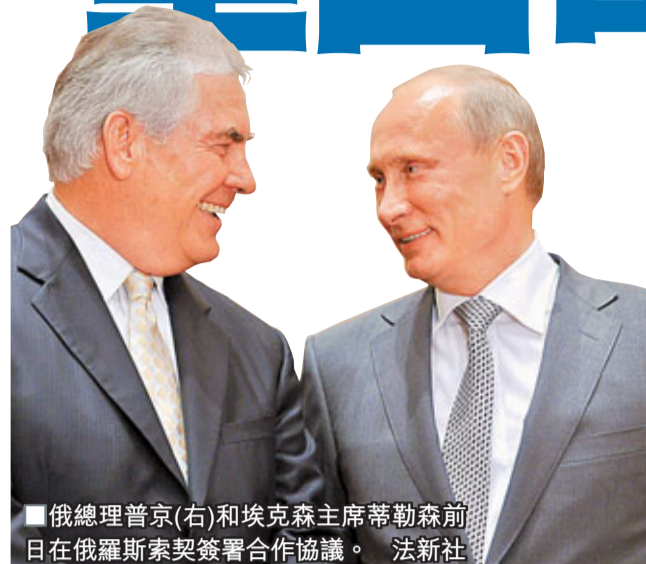
俄總理普京(右)和埃克森主席蒂勒森前日在俄羅斯簽署合作協議。