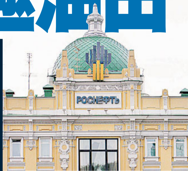
俄羅斯石油公司75%股權由國家持有。