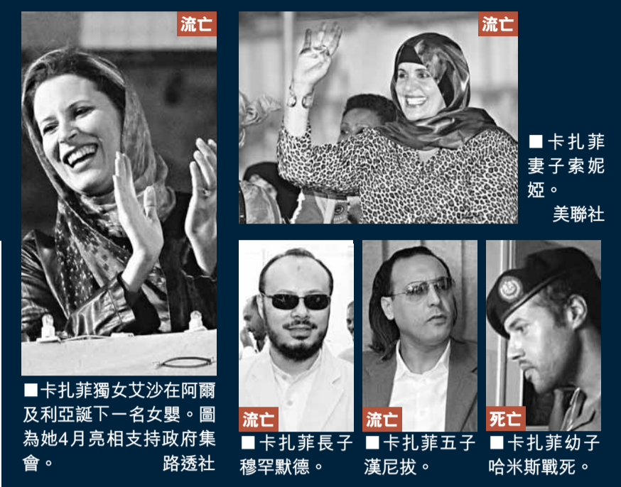
卡扎菲獨女艾沙在阿爾及利亞誕下一名女嬰。圖為她4月亮相支持政府集會。 卡扎菲妻子索妮婭。 卡扎菲長子穆罕默德。 卡扎菲五子漢尼拔。 卡扎菲幼子哈米斯戰死。

稱，反對派即將發動最後一役。美國國務院亦促請利比亞反對派認真考慮引渡「洛克比空難」主嫌邁格拉希，但反對派高層日前指要求「沒意義」。 【法新社/美聯社/路透社/新華社/《泰晤士報》/英國廣播公司