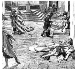
歷史圖畫中黑死病慘況。

14世紀席捲歐洲大陸，導致全歐1/3人口死亡的黑死病，原來時至今時今日，仍然以淋巴腺鼠疫的形式繼續傳播，兩者的病原體基因還非常相似。不過，現代黑死病對人類的威脅已大不如前。