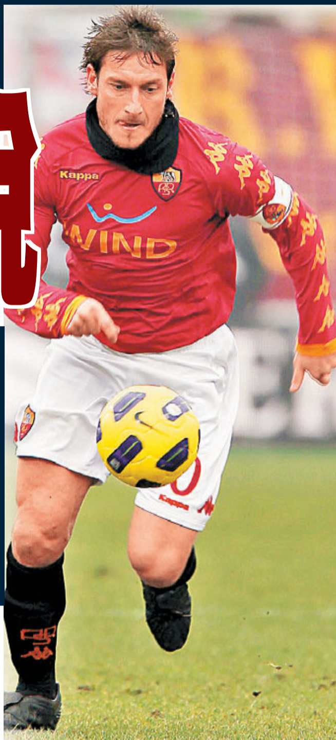
■意大利一眾球星恐將受徵收重稅影響。圖為「羅馬王子」稱號的球星托迪。

美股前日大升200多點後出現獲利回吐，昨日早段低開。道瓊斯工業平均指數昨日早段報11,450點，跌88點；標準普爾500指數報1,199點，跌10點；納斯達克綜合指數報2,544點，跌17點。 經濟數據方面，美國全國房屋價格在第二季有回升跡象，但仍低於2003年水平，反映當地樓市依然脆弱。 ■法新社/彭博通訊社