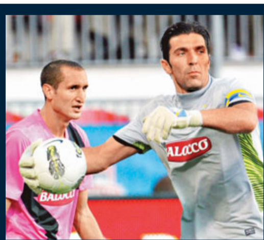
法新社 ■意大利國家隊守門員保方。

101萬港元)以上者應徵收10%稅率，15萬歐元(約169萬港元)以上的更應徵收20%。