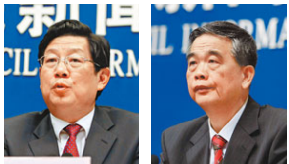
人保部副部長胡曉義 央行行長助理李東榮

據中新社30日電 人力資源和社會保障部副部長胡曉義30日表示，截至今年7月底，中國社會保障卡實際持卡人員達到1.45億人，預計年底前突破1.9億人。此外，人保部與中國人民銀行已聯合發佈通知，決定在社會保障卡上加載金融功能。