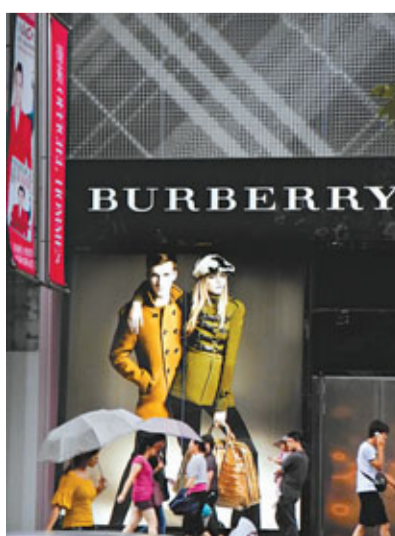
中國今年奢侈品消費額料逾160億。

據悉，奢侈品消費包括境內和境外消費，其中境外消費又被稱為「消費外流」，而外流的奢侈品消費額並不在中國官方進出口統計範圍內，從而抬高了中國的淨出口額，加大了人民幣的升值壓力。故此，從促進國內消費市場就業量、消費額、改善貿易失衡的角度，讓外流奢侈品消費回流到國內，對促進國內消費繁榮具有重要作用。