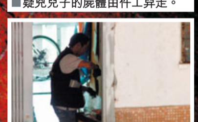
■探員在同袍遇襲單位內蒐證。