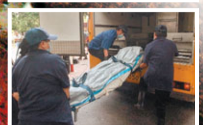
■疑兇兒子的屍體由作工員走。