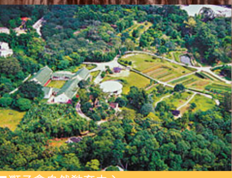
■ 獅子會自然教育中心

—港鐵鑽石山站巴士總站乘92線巴士或96R線 (只行走星期日及公眾假期)，沿指示牌方向步行即達。