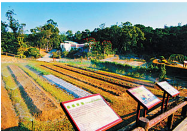
■ 在蕉坑獅子會自然教育中心，備有多個自然場館，更設有有機耕作農地。

距昆蟲館不遠的地方，設有香港首個特為蜻蜓而搭建的蜻蜓池，可供在香港發現的全數蜻蜓類的四分之一約52種蜻蜓生息；另外，中草藥園亦有培植超過100種中草藥，園內中草藥大部分是由香港中醫藥研究所在香港郊野中採集，供公眾參觀。中心戶外亦設有多個示範農田，種植了合時的農作物，一些常見的蔬菜都會在此出現。美果園，顧名思義是一個集滿果樹的園林，它內裡收集超過30種熱帶和亞熱帶果樹，其中大部分是華南品種；而面積約半公頃的標本林則收集了包括香港本地茶花、杜鵑、香港首次發現的植物、風水林的樹木及針葉樹的代表品種。