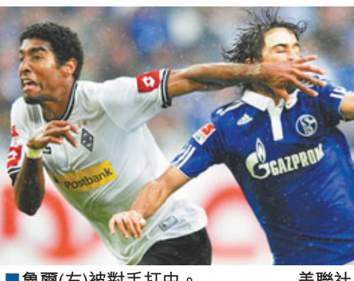
■魯爾(右)被對手打中。