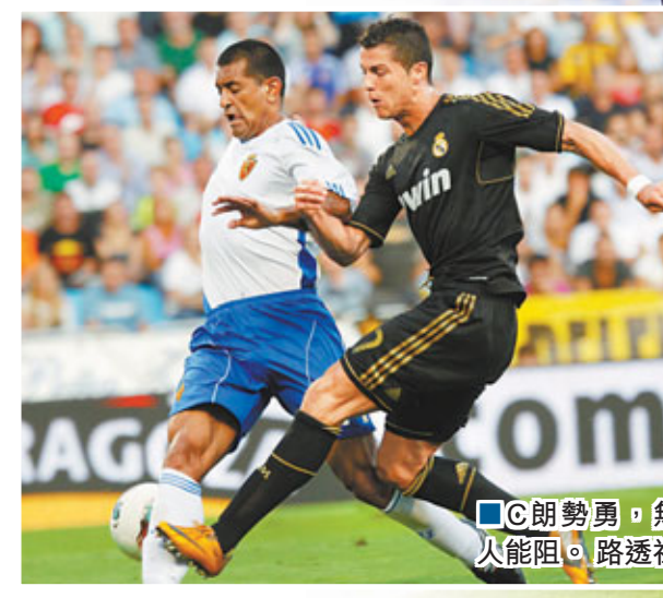
■C朗勢勇，無人能阻。