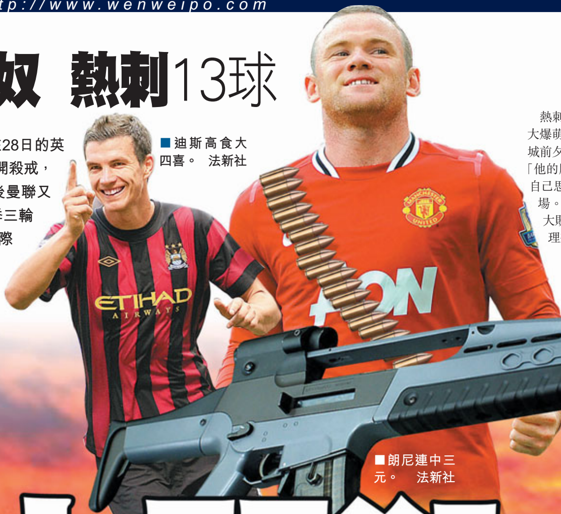
■迪斯高食大四喜。

新華社倫敦28日體育專電 瘋狂！在28日的英超聯賽中，來自曼徹斯特的兩支球隊大開殺戒，先是曼城在客場以5：1大勝熱刺，之後曼聯又在主場以8：2「血洗」阿仙奴。新賽季三輪過後，保持全勝的「曼市雙雄」正用實際行動來彰顯自己奪冠的決心，現時曼聯更以得失球差力壓曼城，暫領群雄。