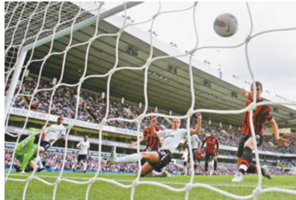
■迪斯高(右)射入第3球。

開場後，曼聯小將在前6分鐘便創造出兩次破門良機。韋碧克終於在第22分鐘把握住機會，用一記頭球破