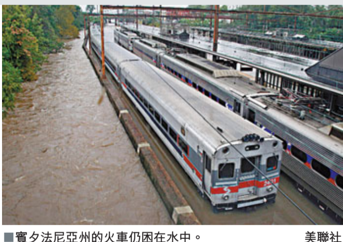
賓夕法尼亞州的火車仍困在水中。

颶風「艾琳」減弱為熱帶風暴後，前日吹襲美國東岸紐約市，為這座大都市帶來了狂風暴雨，但並未造成嚴重人命傷亡和財產損失，可謂不幸中之大幸。「艾琳」至今造成最少32人死亡，據最新估計，這場颶風不如預期嚴重，仍可能會給美國造成70億美元(約546億港元)經濟損失。