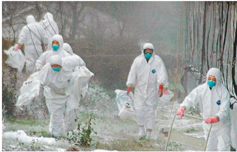
禽流感可導致巨大經濟損失，圖為此前日本檢疫人員進行消毒殺菌行動。