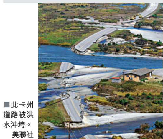
北卡州道路被洪水沖垮。