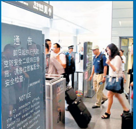
■29日，旅客進入上海虹橋國際機場候機廳。機場設置了通告，請乘客配合安全檢查。