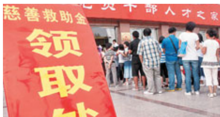
■即將開學，山東濱州市貧困大學生排隊領取救助金。

意見稿指出：信息披露內容包括接受捐贈機構信息、募捐活動信息、接收捐贈信息、捐贈款物使用信息、機構財務信息。日常性捐助信息應在捐贈接受機構收到捐贈後的7個工作日內披露捐贈款物接收信息；重大事件專項信息應在捐贈接受機構收到捐贈後的24小時內披露捐贈款物接收信息或按有關重大事件