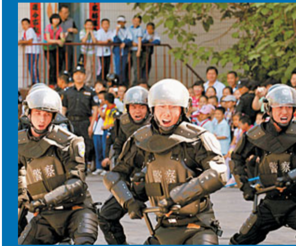
■5月，烏魯木齊特警隊舉行警營開放日活動，為中國—亞歐博覽會安保工作進行綜合檢閱。