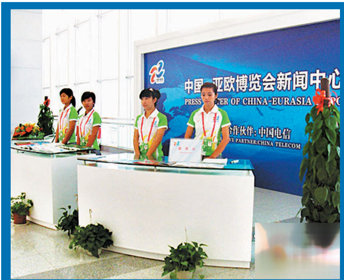
■29日，亞歐博覽會新聞中心正式啟用。

新疆旅遊局相關人士告訴記者，為保證會展期間參會來賓的住宿，執委會接待部目前已對90家三級以上酒店進行了調配。非團體參會的來賓，可根據自己的喜好選擇酒店，憑參會相關證件即可入住接待部為來賓預備的客房。