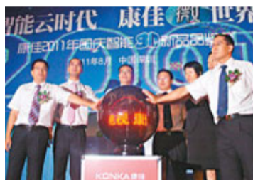
康佳將智能電視與微博等應用功能結合起來，從而引領彩電行業進入「社交時代」。