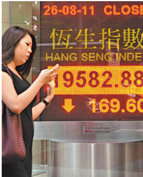
港股上周表現波動, 全周僅升183點, 升幅0.9%, 上落波幅則達872點。