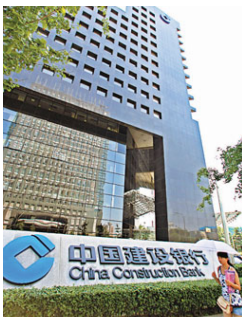
市場認為, 美銀減持建行乃意料中事, 而在消除不利因素後, 建行股價有望追落後。

香港文匯報訊(記者 余美玉) 美銀持有建行(0939)的股份將於今日解禁, 市傳美銀已覺得「接貨人」, 接手持有半數建行股份, 將於今日完成有關交易。不過, 專家指市場早已消化不利消息, 即使美銀減持, 相信亦不會賤價拋售, 建行股價大跌空間不大, 反而消除不利因素後, 有投資者會趁低吸納, 令股價反彈。