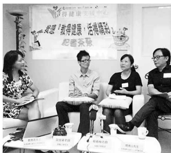
教得健康支援中心的調查指,逾7成教師壓力指數達高壓水平。

子都平日更著緊自己的學業成績及出路,他認為父母先不要過分緊張,以免影響子女情緒,也不要將子女成績作比較,最好可安排子女一同參與輕鬆活動:「多鼓勵他們,對於我們家而言,一齊睇戲是減壓的好方法。」