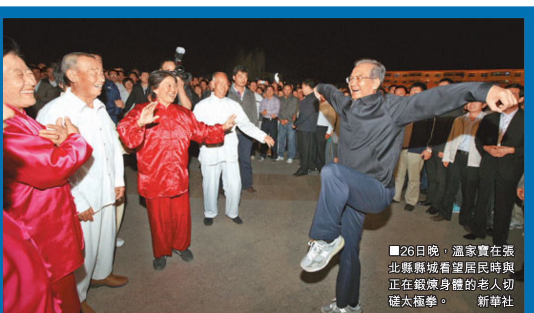
26日晚,溫家寶在張北縣縣城看望居民時與正在鍛煉身體的老人切磋太極拳。

歐盟於1995年首次對中國碳化硅實施反傾銷措施,後歷經2000年和2006年兩次複審延長措施長達16年之久。歐方決定將有利於中國相關產業恢復正常對歐出口。