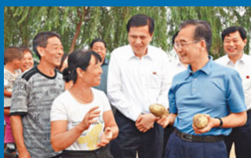
26日,溫家寶在萬全縣宣平堡鄉霍家房村向挖土豆的農民詢問土豆產量、價格和銷路。

溫家寶其後來到張北鎮黑牛溝退耕還林還草工程區。隨後,溫家寶來到康保縣丹清河鄉,走訪萬畝旱作麥田察看麥苗生長情況。下午,溫家寶先後考察了位於沽源縣的塞