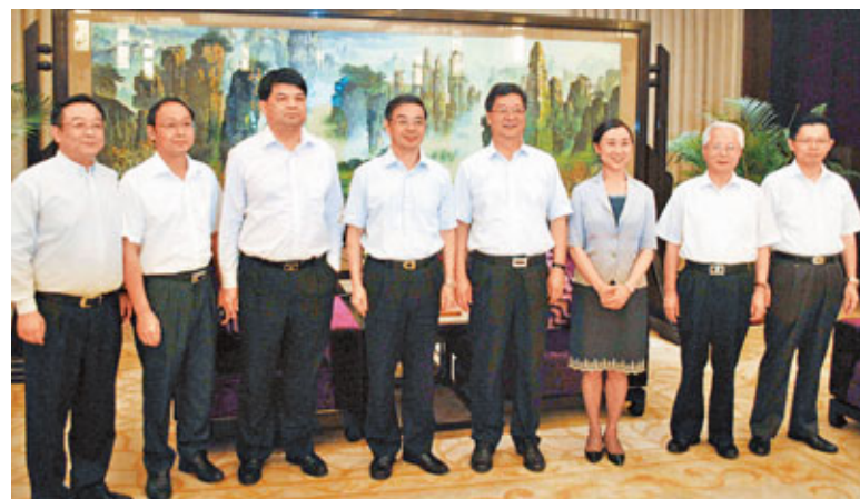
周強(左四)、王樹成(右四)、李微微(右三)等合影留念。

香港文匯報訊(記者 王穎 長沙報導) 27日中午,湖南省委書記、省人大常委主任周強在長沙會見香港文匯報董事長、社長王樹成一行。湖南省委常委、省委統戰部部長李微微,香港文匯報社長助理、辦公室總經理姜增和及湖南辦主任姚進等參加會見。