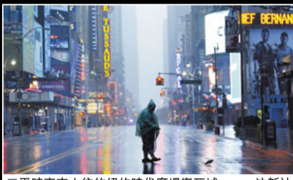
■平時車來人往的紐約時代廣場變死城。

美國主要股票市場預期今天如常開市，但仍未有最終決定。聯邦人員稱，華盛頓地區機場已重開。紐約的機場仍然關閉。