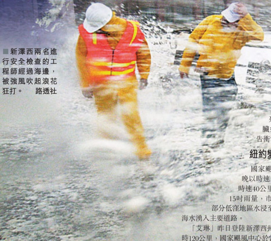
■新澤西兩名進行安全檢查的工程師經過海邊，被強風吹起浪花狂打。