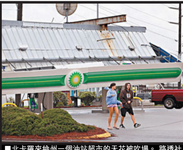
■北卡羅來納州一個加油站超市的天花被吹塌。