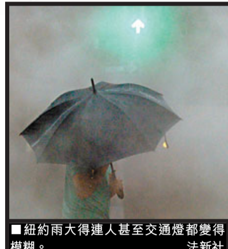
■紐約雨大得連人甚至交通燈都變得模糊。