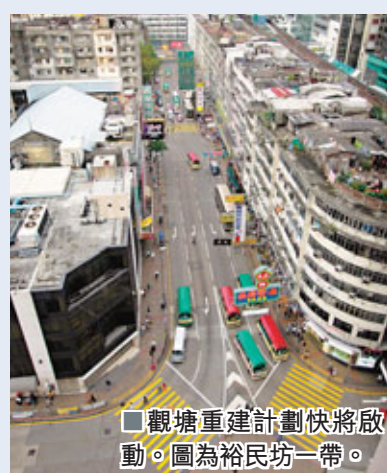
香港文匯報訊(記者 顏倫樂)東南九龍除啟德計劃外,尚有多個項目及基建在建設之中,包括市建局的觀塘市中心大型重建項目、沙中線、中九龍幹線等,近年陸續上馬,再加上政府近年不斷放寬工業地重建限制,以及鼓勵活化工廈等措施,昔日受航機噪音轟炸、工廠污水橫流的烏煙瘴氣之地,正由醜小鸭變成白天鵝。

市建局的觀塘市中心重建項目佔地約5.35公頃(相等於約三分之一個維園),是香港目前最大規模的市區重建計劃,目標是把裕民坊一帶的舊區重建成「新觀塘市中心」,未來將會集住宅、商業、交通、酒店及休閒用途設施於一身。