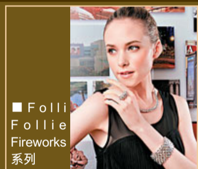
■Folli Follie Fireworks系列

當你看到熊貓、摺扇及龍等造型首飾，你會想起甚麼？今季秋季，Thomas Sabo就是以異國風情為主題，創製了多款熊貓、摺扇及龍等造型的首飾，吹來陣陣東風。它將源自東方的象徵符號，與國際時裝天橋上時尚的元素結合，迸發出耀目的火花。詭秘的黑色、感性的紫色和紅寶的深紅色皆成為Thomas Sabo今季純銀系列的主題色調，營造出強烈的色彩對比，亦正好反映出東方的獨有特色。