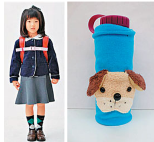
■防「卸膊」書包扣，可穩定兩邊的書包肩帶。

另外，日本人氣郵購公司Fclissimo亦提供一些適合小朋友上學用的貼心產品，如有防「卸膊」書包扣、放午餐盒的日式花樣布袋巾、玩味的藤籃風格水壺袋、可愛的大頭動物水樽套及多用途護腕等。