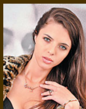
■GUESS閃石頸鍊、手鐲及心形戒指