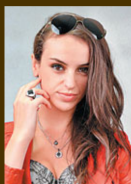
■GUESS黑白復古雙項鍊及戒指