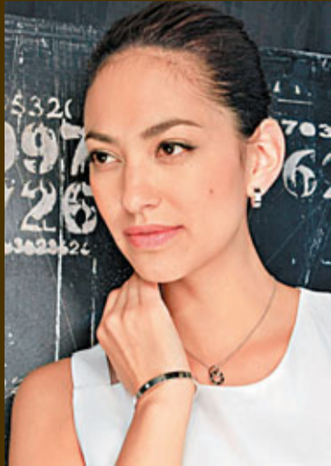
■卡地亞LOVE白金鑲鑽手鐲