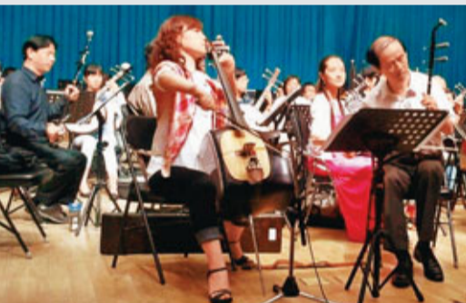
演奏家在「天下為公」音樂會上傾力演出。

香港文匯報訊 香港中樂團聯同中央民族樂團、江蘇省演藝集團民族樂團及中華國樂學會中華國樂團於北京組成百人大型民族樂隊演出「天下為公」音樂會。香港中樂團派出24位團員日前出發前往北京,抵步後隨即匯合其他樂團作演出排練。是次音樂會由兩岸三地著名指揮家陳燮陽、閻惠昌、黃光佑、王愛康等共同擔任指揮,並特邀著名演奏家宋飛、朱自新等加盟演奏。