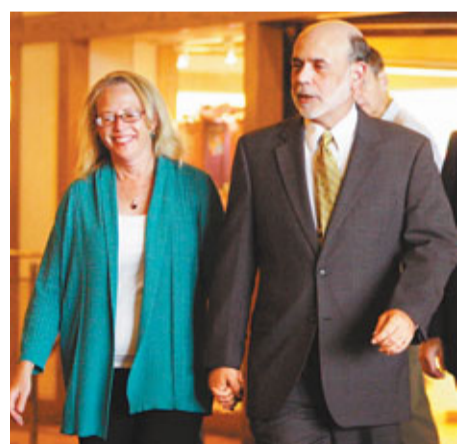
伯南克與妻子安娜出席金融政策會議。

美國聯儲局主席伯南克前日在全球央行年會上，對第3輪量化寬鬆措施(QE3)閉口不提，令市場大失所望。他又指出政府應採取更多措施刺激經濟。報道稱，伯南克的言論暗示局方在貨幣政策上已無能為力，意味著把刺激經濟的責任拋給國會和總統奧巴馬。Capital Economics分析師戴爾斯表示，QE3始終不可或缺，但最快或要到明年初才會出爐。