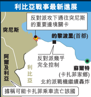
利比亞戰事最新進展

歐盟、非盟及阿拉伯聯盟等組織，前日與聯合國秘書長潘基文就利比亞衝突後重建等問題舉行視像會議，潘基文在會後表示，與會方一致同意，聯合國應在利國戰後重建中發揮主要協調作用，與各組織密切合作，向統一目標邁進。此外，追蹤利比亞外國投資的官員表示，調查發現利比亞投資局(LIA)有人「挪用、誤用及不當使用」資產，有290億美元(約5,457億港元)資產中，有700億美元(約226億港元)不翼而飛，當局會徹查事件。法新社/路透社/美聯社