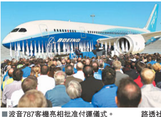
波音787客機亮相批准付運儀式。路透社

研發及建造過程史無前例利用了全球供應鏈，令生產成本大減，為飛機製造開拓新一頁。波音預期到2013年，每月可生產10架夢幻客機。路透社