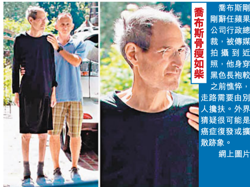
喬布斯剛辭任蘋果公司行政總裁，被傳媒拍攝到近照，他身穿黑色長袍較之前憔悴，走路需要由別人攙扶。外界猜疑很可能是癌症復發或擴散跡象。