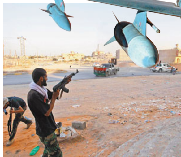
反對派士兵與政府軍士兵交火。