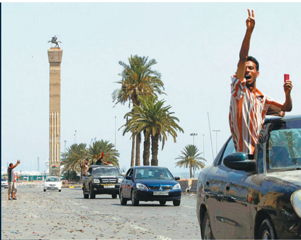
反對派已經徹底控制的黎波里，在市中心「烈士廣場」慶祝勝利，地面佈滿彈殼。