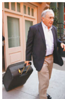
拉加德說：「卡恩要求和昔日同僚，還有任何想(見)他人碰面。他只是希望道別，我認為，他在離開美國前來一次大和解。」她補充說：「所有前總裁都可以回來造訪IMF。」法新社

國際貨幣基金組織(IMF)前總裁卡恩(見圖)前晚抵達美國首府華盛頓探訪昔日同僚，上月接替卡恩出任IMF總裁的拉加德指，卡恩此行「可說是大和解」。