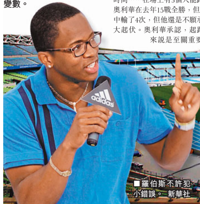
羅伯斯不許犯小錯誤。

回答會不會出現新世界紀錄的問題時，奧利華說：「你不可能預知，我只是想爭取贏得金牌。其實沒人會記得具體的時間……在場上有3個人能跑13秒，你必須成為最好的。」奧利華在去年15戰全勝，但是今夏已在鑽石聯賽中輸了4次，但他還是不願承認自己有很大起伏。奧利華承認，起跑對他來說是至關重要