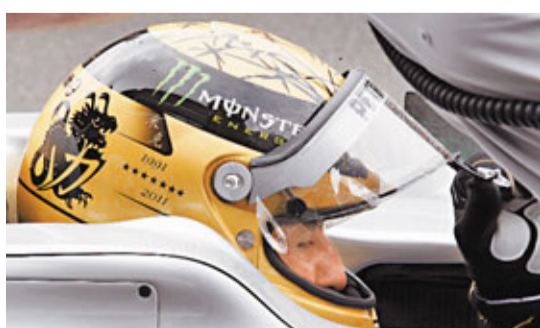
舒麥加戴上特製20周年紀念版金色頭盔。

2000至2004年對法拉利和舒麥加是一段不可複製的傳奇經歷，連續5次車手總冠軍讓舒麥加和法拉利站在F1歷史的頂峰。在官網的一份聲明中，法拉利為「車神」送上最真摯的謝意，法拉利主席蒙特澤莫羅說：「我代表所有法拉利的成員，感謝他為車隊所做的一切，同時為他的20周年紀念送上深深的祝福。」雖然舒麥加征戰賽場的戰袍從法拉利的紅色變成平治的白色，但這並不影響他和「老僱主」之間的感情，他續說：「即使今天在賽道上