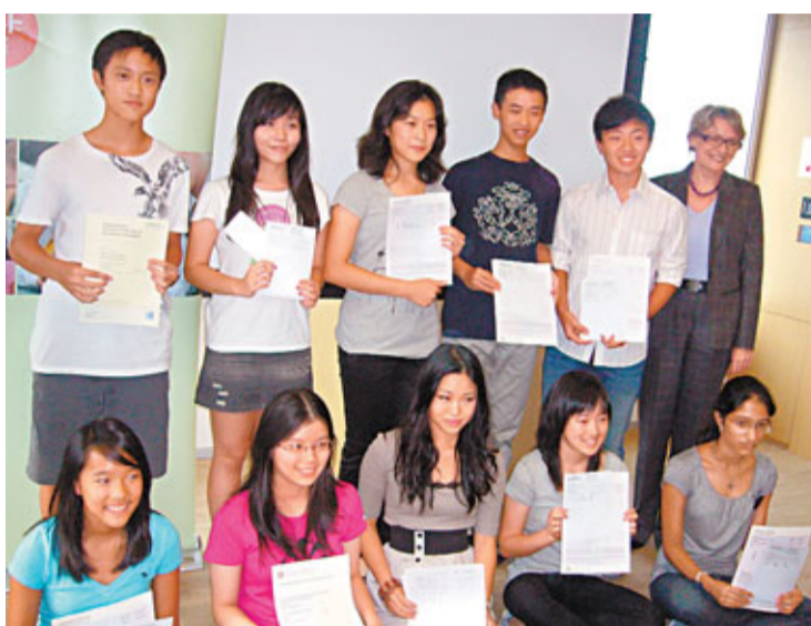
英基狀元 今年英基學校共有967位學生參加了英國的GCSE / IGCSE考試,共取得4,500項A*及A級成績,摘優比率55%,較本土的23.2%為佳。校方昨安排了其中10位考獲10科A*的狀元與傳媒見面,分享讀書心得。香港文匯報記者高鈺攝

油尖旺區家長教師會聯合會長李媽嫻認為,平均4%加幅令人難以承受,「家長面對的不仅是學費開支,其餘通脹壓力亦很大,即使只加1%家長亦已很吃力」。她又指,有部份幼稚園連續多年申請加價獲批,累積加幅驚人。