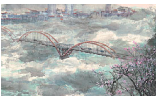
《新富春山居圖》由兩岸畫家攜手繪製,描繪富春江上的風土民情,可看到現代建築物。

去年3月14日,溫家寶總理在全國「兩會」記者會上回答台灣記者提問時,動情講述了《富春山居圖》分藏海峽兩岸的故事,一句「畫是如此,人何以堪」令兩岸同胞動容。為充分表達廣大書畫藝術家對溫總期許祖國和平統一願的積極響應,促進兩岸文化交流,國務院參事室和中央文史研究館策劃組織了這次《新富春山居圖》的創作活動,並決定在9月8日中央文史研究館成立60周年之際,在國家博物館首次舉辦《新富春山居