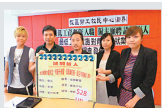
有勞工團體發現,部分僱主以「培訓費用」為名剝削學徒工資。

香港文匯報訊(記者 曾雁翔)最低工資實施近4個月,影響陸續浮現。有勞工團體發現,有僱主涉嫌走「法律罅」,以時薪28元聘請「學徒」,卻藉「培訓費」等名目,扣減20%工資。另外,有僱主投訴,最低工資令年輕僱員抱有「做又28,唔做又28」心態,養成惰性。有鑑於此,僱主更難聘請合適人才。