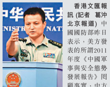
香港文匯報訊(記者 葛沖 北京報導)中國國防部昨日表示,美方發表的所謂2011年度《中國軍事與安全態勢發展報告》罔顧事實,中方對此表示強烈不滿和堅決反對,已向美方提出嚴正交涉。

針對美方在報告對中方的無端指責,中國國防部新聞發言人楊宇軍(見圖)26日在回應香港文匯報提問時指出,2011年度《中國軍事與安全態勢發展報告》罔顧事實,指責中國正常的國防和軍隊建設,渲染所謂大陸對台「軍事威脅」,無端質疑中國的空間和網絡安全政策。中方對此表示強烈不滿和堅決反對。他說,中方已向美方提出嚴正交涉。