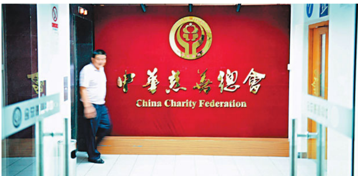
■近幾個月一系列的慈善事件風波,已演變為中華慈善總會等幾大慈善機構的信譽危機。圖為北京市的中華慈善總會辦公區。

2009年開始起草的《社會募捐條例》以及《慈善法》至今難產,鄭遠長坦言,進展不理想,相關部門對一些關鍵問題還沒達成共識,如公益慈善組織的界定、慈善