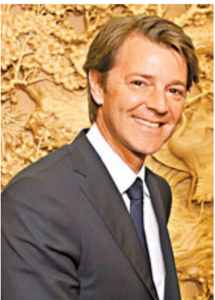
(SDR)的一攬子貨幣問題提出方案。巴魯安在法國駐華大使館舉行記者會時說,雙方討論了國際貨幣體系改革以及人民

幣國際化等議題。他說:「我們與中方討論了關於人民幣可兌換性,如何制定路線圖,人民幣將逐步走向自由兌換和國際化,法方希望人民幣可以符合中國的情況和地位。」