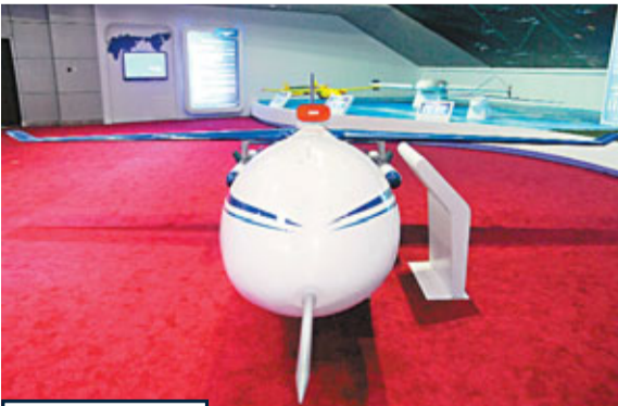
無人機亮相 26日,中國飛航導彈事業的「搖籃」——中國飛航技術研究院(又稱中國航天科工集團公司第三研究院,前身為錢學森組建的國防部五院三分院)慶祝建院50周年展廳中,展示該院自主研製的WJ-600中程高速無人機。WJ-600無人機系統是可裝載光電偵察、合成孔徑雷達、電子偵察等任務設備,全天時、全天候執行戰場偵察和毀傷效果評估等任務,並在國土資源等民用領域有重要推廣應用價值。其最大任務載重130公斤,巡航速度500-700公里/小時,航程不小於1,500公里,巡航時間3.5-5小時。WJ-600無人機亮相珠海航展時,曾引起業界廣泛關注。

美國國防部於當地時間24日下午發佈的最新報告長達94頁,主要內容仍是中國軍力發展、台海安全形勢發展、中國軍事現代化進程等諸多方面。