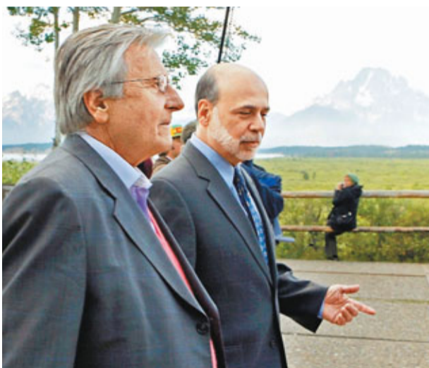
美國聯儲局主席伯南克和歐洲央行行長特里謝出席會議前相約在酒店散步。

美國聯儲局昨在懷俄明州舉行全球央行年會。聯儲局主席伯南克發表講話稱，該局仍有工具刺激經濟，但沒有提供詳情。市場對伯南克未提出第3輪量化寬鬆政策(QE3)失望，美股在伯南克講話後一度急跌220點；但他其後指經濟仍然會維持增長的言論穩住大市，美股隨後倒升。同時，美國商務部公布第2季經濟增長向下修正為1%，顯示經濟勢頭仍然疲弱；結束亞洲之旅的副總統拜登表示，美國需要「更多經濟刺激措施」。