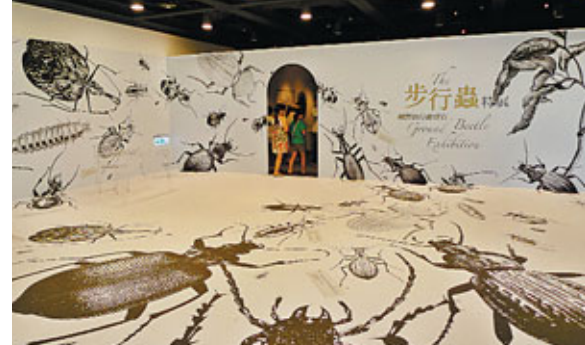
■蘭博所舉辦的「曠野的行動寶石——步行蟲」展。