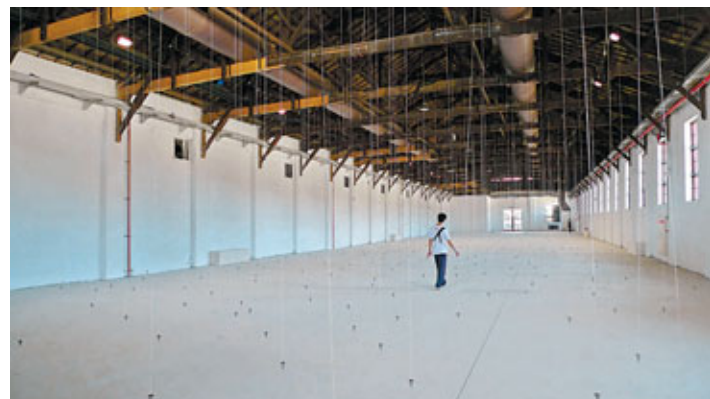
■《與佛塞同步——威廉·佛塞新媒體藝術系列展覽》中的一景：《無處又遍處》。