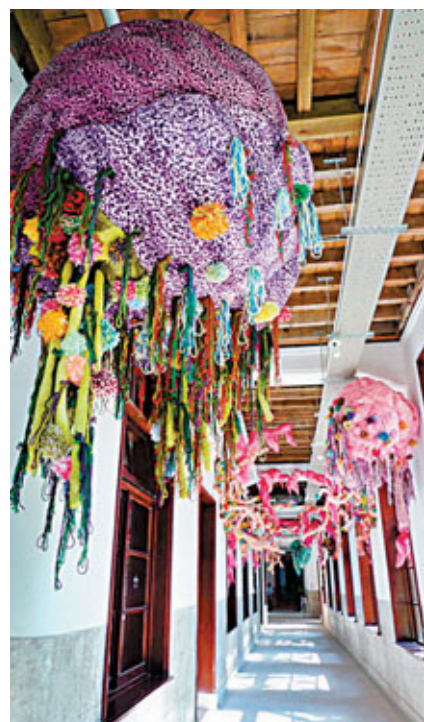
■松山文化區，老建築中的新藝術。