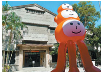
■松山文化區中一景。

第13屆台北藝術節上月底於台北松山文化創意園區（下稱「松山」）開幕。除了演出、展覽和周邊的講座導賞，今屆台北藝術節還有一項重要任務，就是開拓和宣介「松山」這個嶄新的藝術空間。2001年，前身為松山煙草工廠的「松山」，由台北市政府指定部分建築物為市定古蹟，經過長期的規劃與整建過後，今屆台北藝術節以此為大本營，安排大部分演出和重點多媒體展覽在「松山」進行，藉此帶動藝術人口對台北全新文化園區的認識。