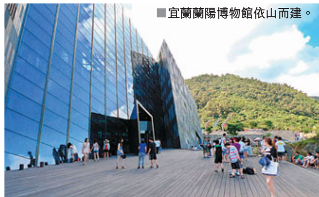
■宜蘭蘭陽博物館依山而建。

步出台北市國父紀念館捷運站，不遠處便是沙塵滾滾的「松山」。之所以「沙塵滾滾」，全因為「松山」還在修整當中，準備在未來半年發展為繼華山文化創意園區後（下稱「華山」），第二個位於台北市中心的文化創意基地，更將於十月舉行台北世界設計大展。因此，本屆台北藝術節的演出和展覽，率先集中在四幢已修整完善的古董級建築物中進行，包括波蘭克拉科夫老劇院劇團的《麗特·丹妮·佛斯》（Ritter, Dene, Voss）、來自加拿大劇團創作人的《樂觀主義精選集》（An Anthology of Optimism）和台灣無獨有偶工作室的《洪通計劃》等，均在「松山」一號倉庫「打頭陣」。