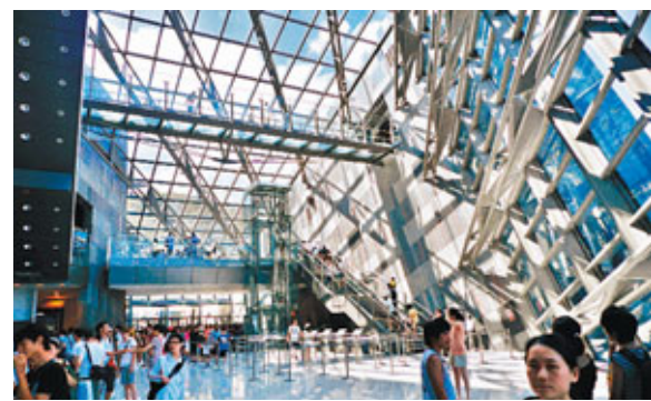
■宜蘭蘭陽博物館內部空間十分具現代感。

同為新場地新展館，「松山」與「蘭博」一個老建築新藝術、一個後現代外觀盛載在地文化風貌，恰成強烈對比。想當然的是，台北「松山」與宜蘭「蘭博」畢竟所在地不同，所指向的策展對象和功能亦有異。它們所展現的，除了是不同的藝術主題和文化氛圍，同時也是台灣城市和地方所抱持的多元共生價值觀。