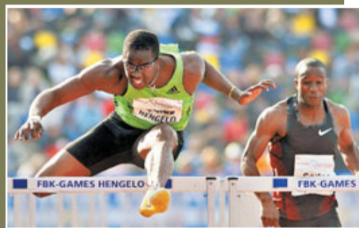
羅伯斯大談世錦賽勁敵。 資料圖片

新華社巴黎25日體育專電 古巴天才選手羅伯斯25日表示，「中國飛人」劉翔和美國名將奧利華將是他在大邱田徑世錦賽的主要對手。「近幾年我和奧利華的競爭十分激烈，劉翔也是一個偉大的對手。」羅伯斯接受採訪時說。在羅伯斯看來，目前世界男子110米欄的競爭版圖就是他和劉翔以及奧利華之間「三國爭霸」，和阿倫莊遜時代有幾分相似，「我覺得（這樣的競爭關係）就像是跨欄比賽中一種傳統的延續，就像過去的阿倫莊遜、金德姆和傑克遜一樣。」