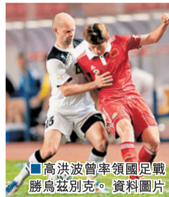
高洪波曾率領國足隊勝烏茲別克。 資料圖片

因此，塔吉克足協將目光鎖定了高洪波的身上及其對同組對手的了解程度。高洪波帶領國足期間，在與同組的日本、烏茲別克、朝鮮3支球隊進行的4場國際A級賽事中未嘗敗績，取得了總共2勝2和；故塔吉克足協認為，「高洪波的優勢在於對這三個對手的了解程度，而且能夠找到擊敗對手的辦法。」