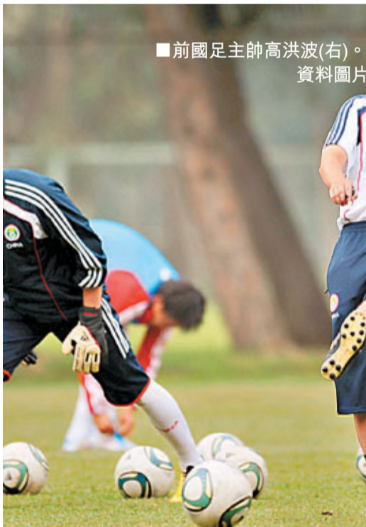
前國足主帥高洪波(右)。 資料圖片

香港文匯報訊（記者 梁啟剛）據昨日《搜狐體育》報道，國內媒體爆出一則猛料，稱剛剛卸任的前國足主帥高洪波已經收到了塔吉克足協的邀請；作為世界盃亞洲區外圍賽20強賽(世外賽20強賽)的替補軍團，塔吉克的實力不容小覷，而這次力邀高洪波入主正是看重了其在國足期間取得的良好戰績。雖然高洪波確實收到了塔吉克足協的邀請，但他已經婉拒對方。世外賽20強賽近在眼前，塔吉克臨陣找帥也是無奈之舉。在世外賽第一階段中，塔吉克已經被敘利亞淘汰出局，如此一來，2014年世界盃看來是沒塔吉克什麼事了。但前一階段，國際足協查出敘利亞國家隊內一名球員違規出場，就此取消了敘利亞世外賽20強賽的資格。因此，國際足協在北京時間的8月20日宣佈了關於取消敘利亞20強賽資格的決定，其資格由塔吉克取代。就是這突如其來的幸事徹底打亂了塔吉克足協的部署，足協不得不再次「揚帆起