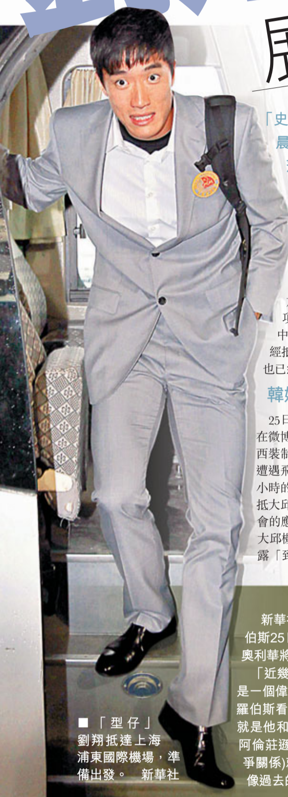
「型仔」劉翔抵達上海浦東國際機場，準備出發。