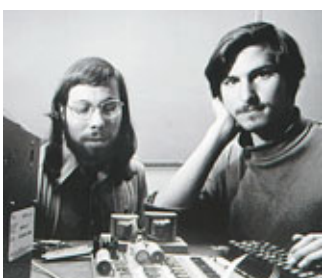
沃茲尼亞克(左)與喬布斯(右)共同創辦蘋果公司。

變市場格局，競爭者若走慢一步隨時會被淘汰。多得喬布斯大力推動，流動設備已成為很多人生活不可或缺的一部分，但技術與生活聯繫到極端程度，外界亦開始關注個人私隱受侵犯，成為蘋果產品引起的爭議。