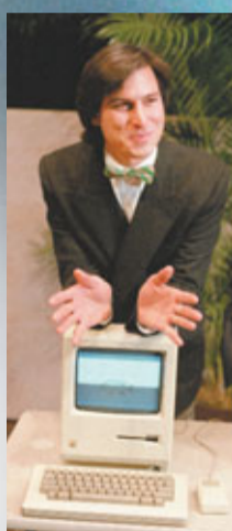
喬布斯1984年展示首部Mac電腦。