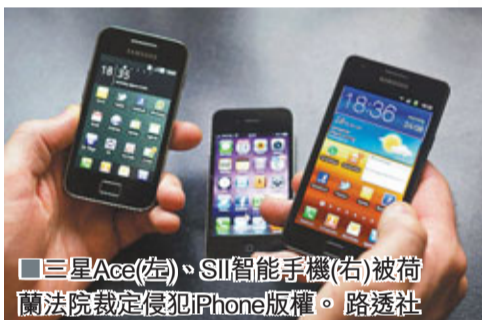
三星Ace(左)、SII智能手機(右)被荷蘭法院裁定侵犯iPhone版權。

蘋果公司的一舉一動,均受業界關注,喬布斯退下行政總裁職位的消息,或有利一眾競爭對手。分析指出,其中在智能手機和平板電腦市場均與蘋果「爭崩頭」的韓國三星電子,無論短期或長期都受惠不淺。三星的Galaxy系列智能手機和平板電腦,是