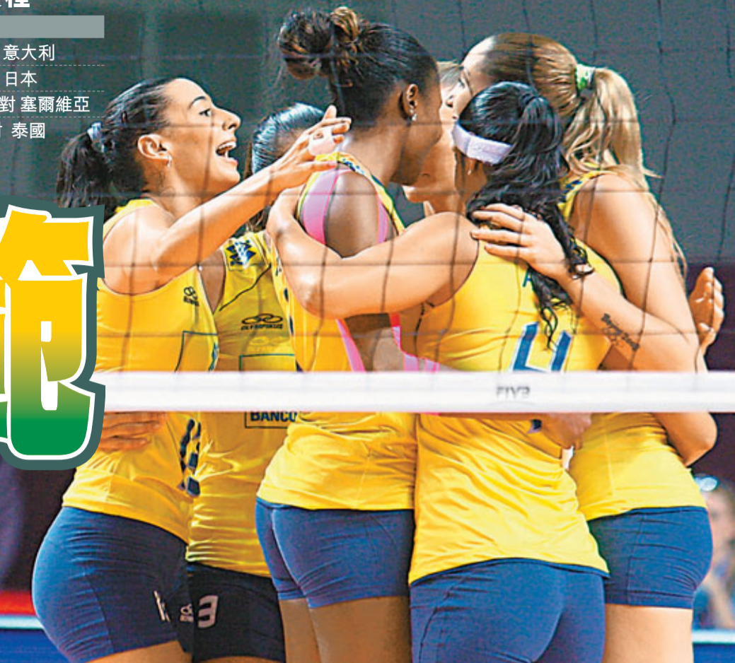
■巴西女排慶祝取得總決賽開門紅。