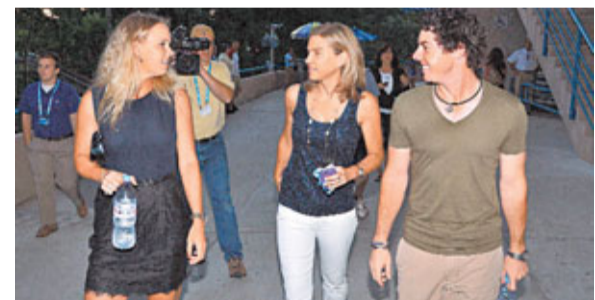
■禾絲妮雅琪(左)獲男友、北愛爾蘭高球手麥基爾羅伊(右)現身撐場。