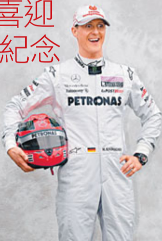
■舒麥加在比利時站有很多難忘回憶。資料圖片

7屆F1世界冠軍舒麥加將於本週末的比利時站賽事，迎來個人F1賽車生涯的20周年紀念。事實上，比利時站的斯帕賽道正是舒麥加成就傳奇的最佳印證。 舒麥加在1991年8月25日的比利時站為當年的佐敦車隊上演F1處子秀，開始其輝煌的F1之旅，而這項7屆世界冠軍在斯帕賽道亦擁有很多難忘的回憶，包括在1995年由第16位起步而贏得最終勝利，以及在1998年一度領先接近40秒，分站冠軍手到拿來的情况下，意外與「慢車」古達相撞等經典場面。