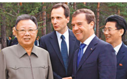
金正日(左)與梅德韋傑夫(右)言笑甚歡。

正在俄羅斯遠東地區訪問的朝鮮最高領導人金正日，昨日與俄總統梅德韋傑夫會談。據俄方表示，朝方在會上同意無條件重啟六方會談，並暫停大殺傷力武器試驗。金正日昨晚專列準備回國，韓國媒體關注他在途中會否與俄總理普京會面。