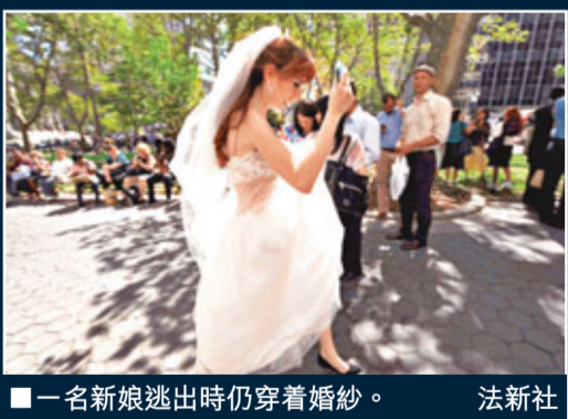
一名新娘逃出時仍穿着婚紗。