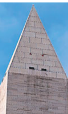
華盛頓紀念碑頂部受損。

地震令國會大樓輕微損毀，顏料和石膏散落在地上，部分地方出現裂縫；華盛頓紀念碑亦出現裂痕，華盛頓國家大教堂、林肯紀念堂等暫時關閉進行檢查。