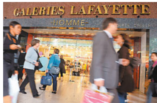
法國計劃大手削赤，並向富豪「開刀」。圖為巴黎老佛爺百貨商店。

意大利和西班牙飽受債務危機困擾之際，歐元區第二大經濟體法國的經濟同樣如履薄冰。為遏抑持續上升的財政赤字，法國政府昨日公布對策措施，包括削減公共開支和加稅，向超級富豪額外徵稅，目標在兩年內削減約120億歐元(約1,348億港元)財赤。