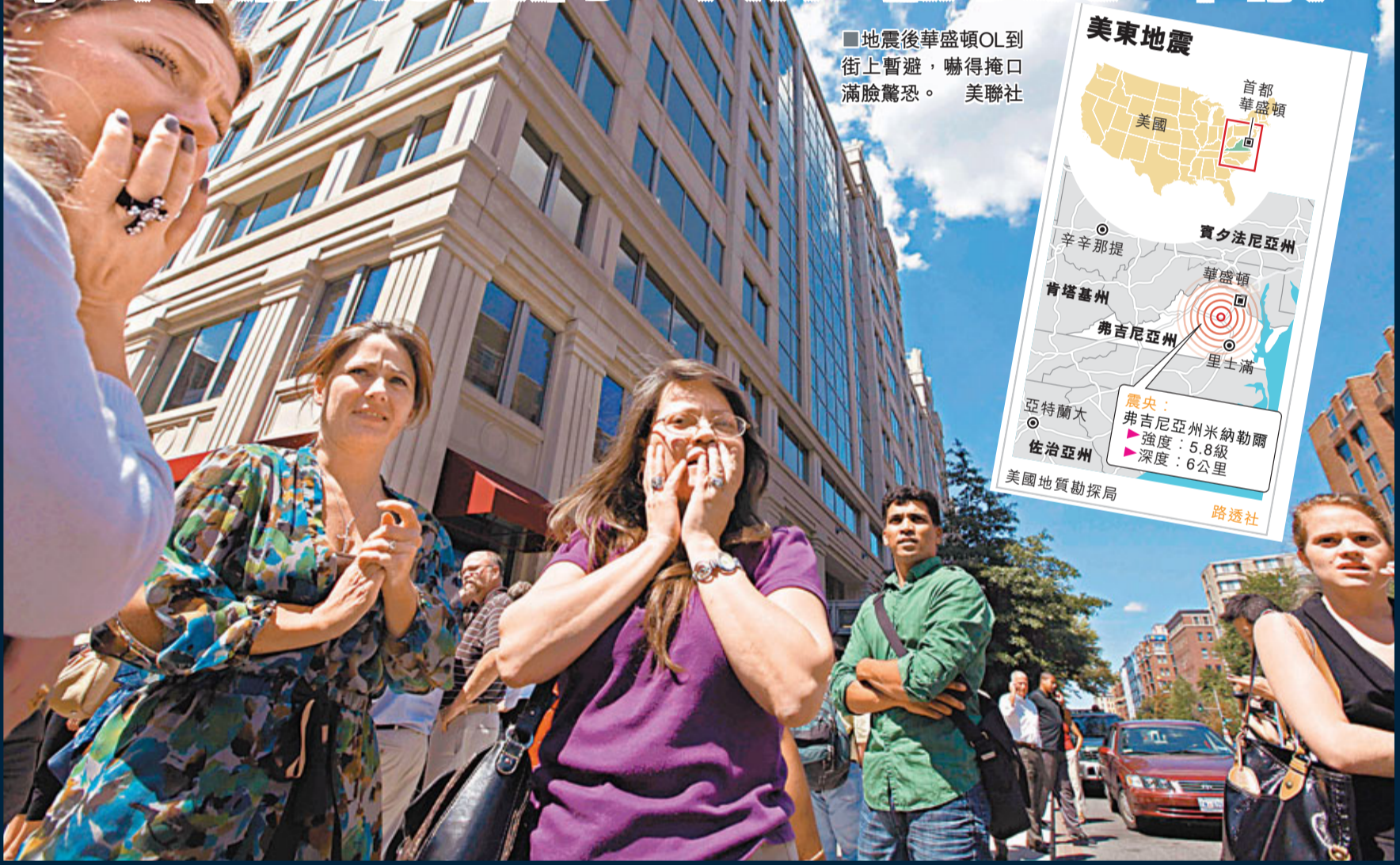
地震後華盛頓OL到街上暫避，嚇得掩口滿臉驚恐。