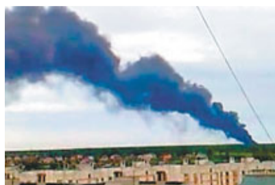
電視畫面顯示，靶場黑煙衝天。

這是該軍事訓練場今年第2次爆炸事故。4月11日，訓練場一名倉庫職員工作時，因違反消防安全規定，令儲存在漏檢彈藥箱內一枚76毫米炮彈