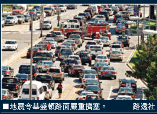
地震令華盛頓路面嚴重擠塞。