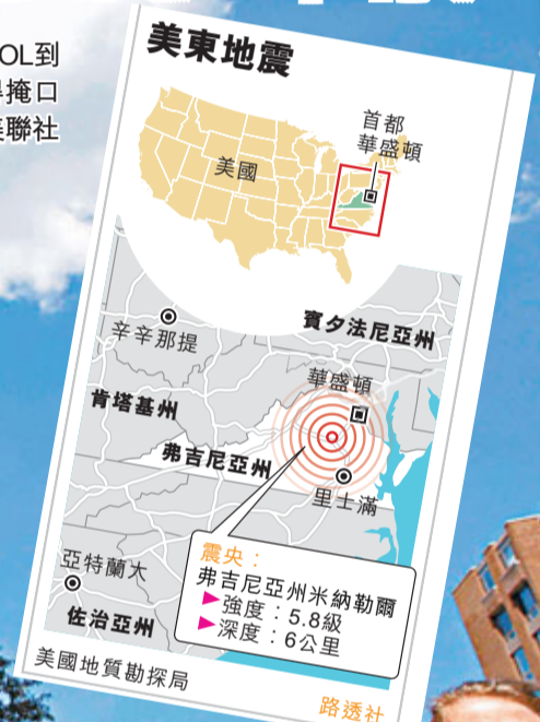
美國地質勘探局 路透社