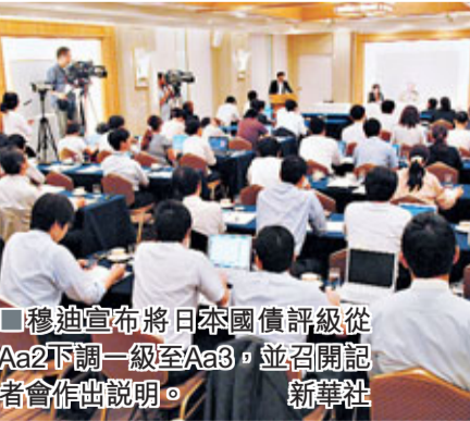
穆迪宣布將日本國債評級從Aa2下調一級至Aa3，並召開記者會作出說明。