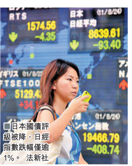
日本國債評級被降，日經指數跌幅逾1%。法新社

穆迪下調日本評級後，日圓匯價曾稍為回落，但由於財相野田佳彥的匯市新措施未能令市場滿意，圓匯之後重上1美元兌76.64日圓水平。 ■共同社/法新社