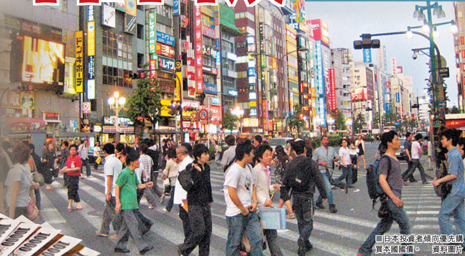
日本投資者傾向優先購買本國國債。資料圖片