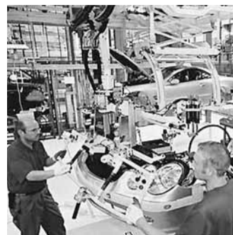
德國製造業增長速度是近兩年來最慢。圖為該國車廠。

歐元區本月製造業的指數—採購經理指數(PMI)兩年來首次收縮，顯示歐元區經濟逐漸失去增長動力。同時，希臘債務危機繼續惡化，該國財長韋尼澤洛斯預料，希臘經濟衰退今年進一步加劇。