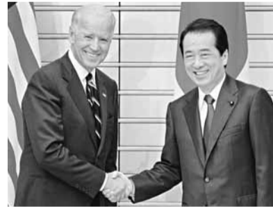
拜登(左)會晤菅直人。