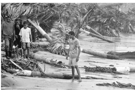
颶風艾琳吹倒多米尼加沿岸樹木。

正在加勒比海高速移動的颶風艾琳，昨日橫掃多米尼加共和國北部海岸，並增強為2級颶風，預計會成為近3年來，首個嚴重威脅美國的颶風。