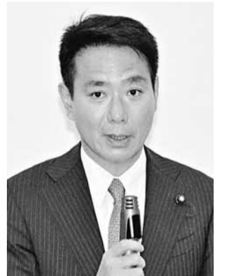
菅直人昨日在內閣成員懇談會上重申，國會通過《公債發行特例法案》及《再生能源特別措施法案》後，他或會於下周二辭職。