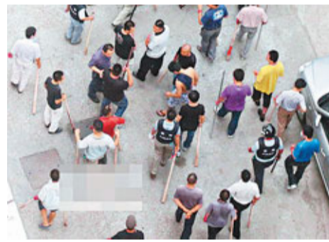
患者家屬與不明身份打手持棍棒對峙。

與此同時, 不少網友通過微博發帖稱, 北京地區上空當晚也出現了可以移動的奇怪光團。