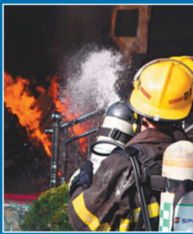
消防人員全力滅火。