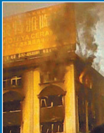
網友微博照顯示, 頂樓火勢最大。