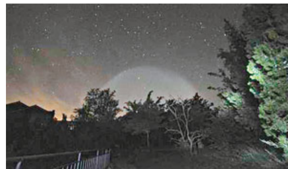
近日多地多人目擊巨大白色光球。 網上圖片