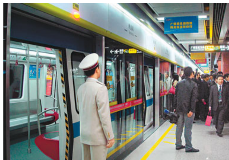
廣佛地鐵開通10個月, 客流量僅為設計容量的一半。 資料圖片