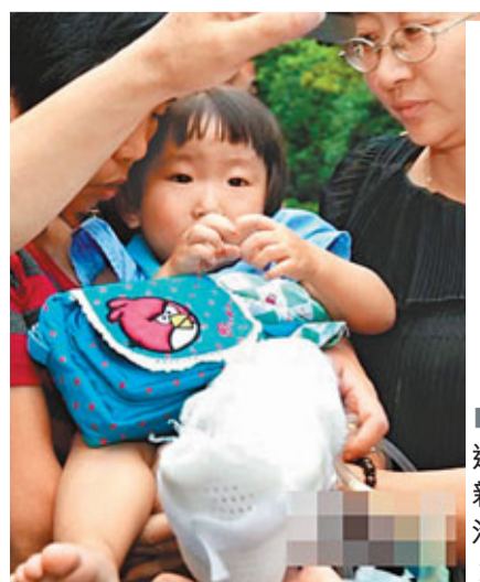
小伊伊進入上海新華醫院治療。

溫州市鹿城區善後處置領導小組成員處獲悉, 除個別遇難者家屬仍在住院無法簽署協議等特殊原因外, 絕大多數遇難者家屬已經簽訂了賠償協議, 遇難者理賠工作基本完成。