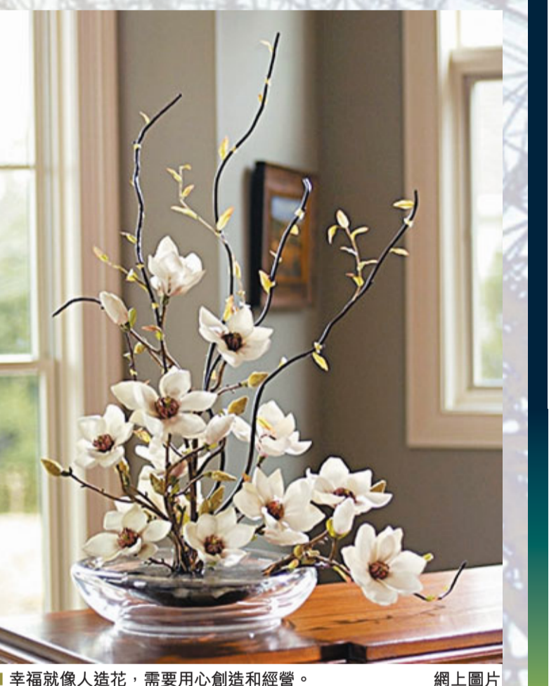
幸福就像人造花,需要用心創造和經營。