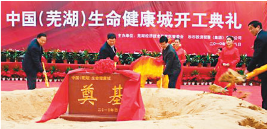
■蕪湖生命健康城開工建設。

另一方面，在蕪湖高新區，投資3億美元的海格斯能源科技產業園正在建設，海格斯外方負責人Alexis（愛麗克