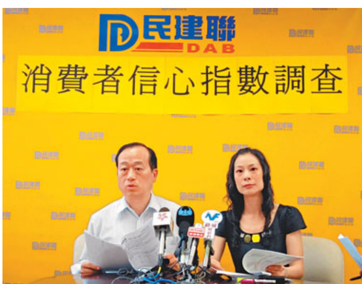
■民建聯調查發現，香港市民的消費者信心指數較去年底下跌，49.1%受訪者認為未來1年經濟前景會轉差。

在外圍歐美債務危機持續影響全球下，港人對個人或香港整體經濟前景看法同樣悲觀。受訪者展望未來1年個人財政狀況時，只有11.9%人預期會「轉好」，認為會「轉差」的則進一步增至39%；在展望未來1年香港經濟前景時，認為會「轉好」的比去年底時大幅減至只有11.7%，這是調查以來最低的水平，但認為會「轉差」的卻由上次40%進一步增至49.1%。至於較長遠的展望，受訪者亦較上次調查結果審慎，預料未來5年會「持續不景」的受訪者續增至46.1%，而