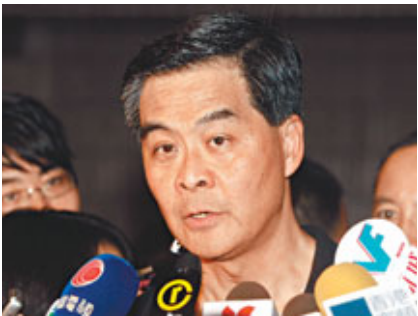
■梁振英認為應尊重他人表達意見的權利。

香港文匯報訊(記者 鄭治祖)有反對外傭爭取居港權的市民日前舉行遊行，受到支持外傭人士阻擾，一度發生衝突。行政會議召集人梁振英昨日批評，因有不同的看法而造成一些肢體的衝撞，影響到香港社會的和諧和秩序，大家應尊重他人表達意見的權利，但他不評論外傭居留權案。