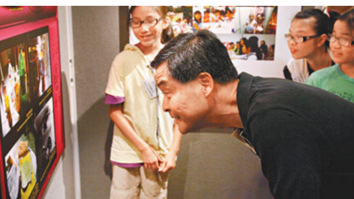
■梁振英出席貧窮兒童攝影展。

「大家樂是有錢人吃的」。只有9歲的林泳茵用相機拍下一幅大家樂店面的照片，藉以描繪自己心中的社會感覺，發人深省。香港社區組織協會正於尖沙咀文化中心舉辦貧窮兒童親自拍攝的攝影展，昨日還邀得行政會議召集人梁振英出席揭幕禮。CY於儀式上形容，貧窮兒童鏡頭下的「灰色地方」不能用美術或電腦加工，使之變得色彩斑斕，但他相信，以香港社會的平均經濟發展水平，完全有能力給基層家庭更好的資源，讓他們通過自己的努力、奮鬥去創造更加美好的未來，有更充實的人生。