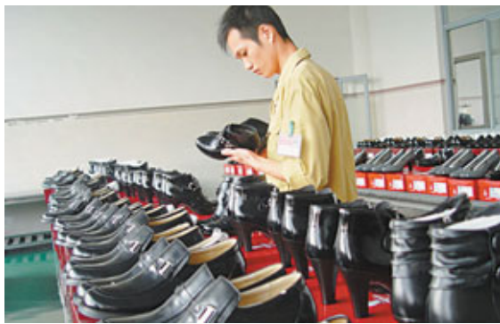
■鞋業等傳統優勢產業仍是溫州拉動出口的主要力量。

香港文匯報訊（記者 白林森 溫州報道）溫州海關日前公佈數據稱，今年1至7月，溫州市外貿出口總額突破100億美元大關，達100.71億美元。其中，7月