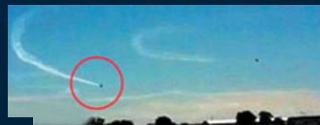
■「紅箭」飛機墜機前一刻飛離預定航線，衝向田野。

英國一架「紅箭」飛機前日飛行表演期間故障，33歲新婚機師為免飛機撞落房屋和行人，控制飛機至最後一刻，把飛機轉向墜落田野，結果他未能及時彈出逃生而犧牲。