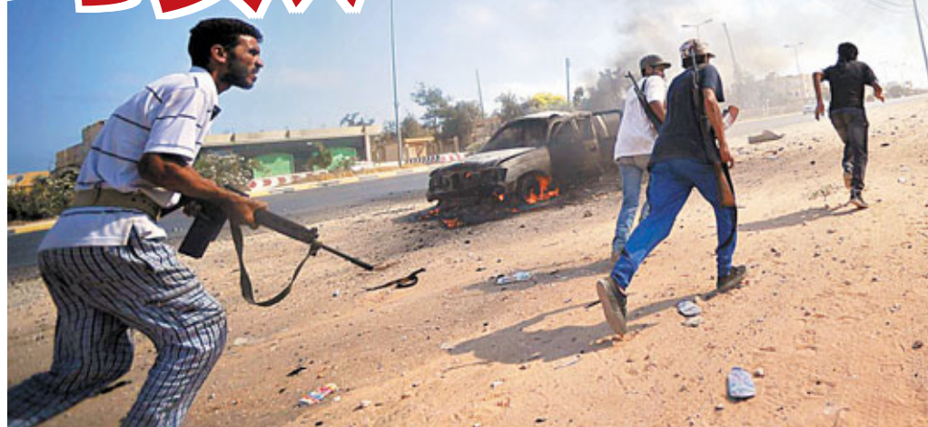
■「革命軍」在的黎波里郊區與政府軍激戰。

利比亞戰事進入關鍵時刻，反對派聲稱已佔據首都的黎波里國際機場及附近一個油庫，「革命軍」在首都與政府軍爆發激烈巷戰，昨日凌晨更發生4次強烈爆炸，目標未明。領袖卡扎菲並未言敗，堅稱仍控制首都，呼籲支持者負隅頑抗，將「賣國賊」徹底消滅。利比亞政府稱，戰鬥導致雙方共376人死，逾千人傷。反對派稱，卡扎菲已「時日無多」。