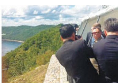
■金正日參觀俄遠東地區水力發電站。