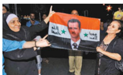
■巴沙爾的支持者上街示威與反對派打對台。美聯社

員會評估當地人權狀況及援助需要，小組沒透露會到哪個城市，但會逗留當地直至周四。敘利亞爆發反政府革命5個多月，聯合國稱至今造成近2,000人死亡。■路透社/美聯社