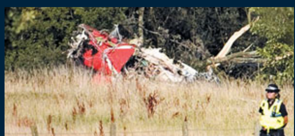
■飛機殘骸尋獲，機師證實殉職。