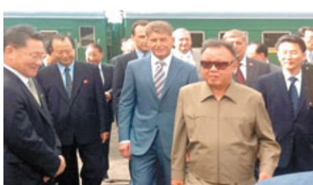
■金正日在火車站受到俄方歡迎。

正在俄羅斯訪問的朝鮮最高領導人金正日，昨日抵達俄國遠東的阿穆爾地區，獲俄方以紅地毯隆重歡迎。他其後參觀俄遠東區最大水力發電站，預料明日與俄總統梅德韋傑夫會面，討論雙邊經濟合作、俄國援助朝鮮及重啟六方會談等議題。金正日接班人金正恩並無隨行訪俄。