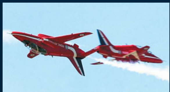
■「紅箭」飛機以往的精彩表演。