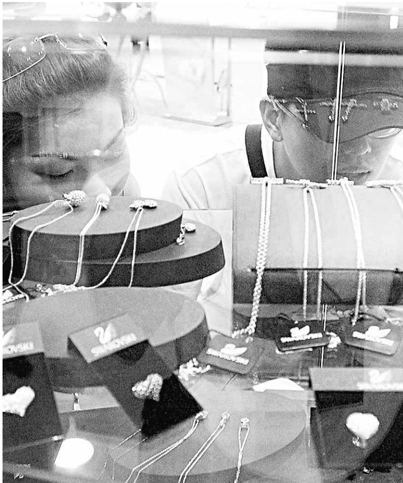
金價狂飆，讓島內不少新人對購買金飾望之卻步，轉向考慮「租金飾」。

有銀樓業者打出「3000元租借整套新娘金飾」的服務，結婚好日子甚至一天的出租率高達15-20套，讓新人只要花幾千元，即可將價值15萬元、重達2兩的整組金飾穿戴上身。老闆娘透露，原本只是想讓新人以最節