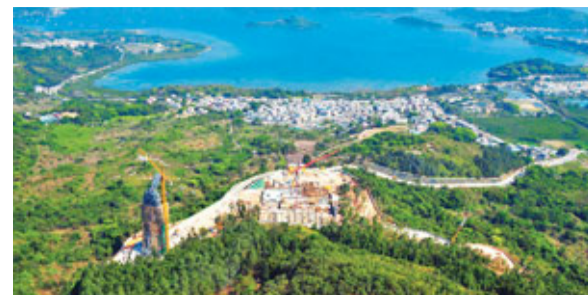
慈山寺在多份報章刊登聲明,直斥《蘋果日報》報道扭曲失實,嚴重損害慈山寺組織和李嘉誠的名譽。曾表示,李嘉誠先生有此佛心很不可思議,「他一個人出錢,給全世界人禮佛,並無求回報」。

據了解,李嘉誠特別有感於香港人承受重大精神及生活壓力,認為如能提供一個清幽寧謐的弘法道場,供大眾禮佛,以及聆聽具修為的出家人講經,有助紓緩生活及精神壓力,化解消極情緒,增進港人福祉。覺光法師