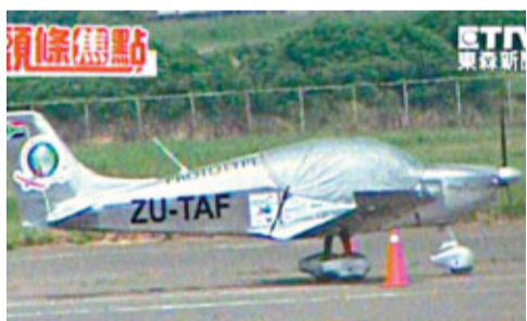
小飛機誤闖跑道，令華航一航班延誤。

香港文匯報訊 據《聯合報》報導，一架私人單螺旋槳飛機19日下午從泰國普吉島飛到桃園機場降落後，疑因對機場陌生又誤解塔台指示，差點與正準備起飛的華航班機相撞，幸好塔台人員立即通知華航班機放棄起飛，才未釀成事故。對於小飛機為何會誤解塔台指令，台灣當局將進一步了解。