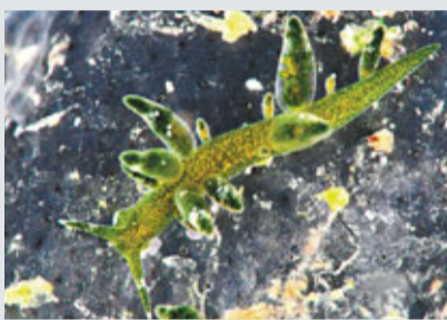
肯果柱狀海天牛。

墾管處說，「肯果柱狀海天牛」原本只記錄在澳洲的大堡礁、北昆士蘭到關島的物種，這次在墾丁發現，代表在台灣與墾丁生物多樣性上面具有相當的意義。