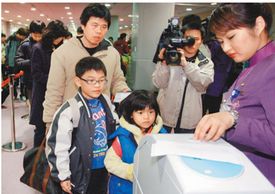
春節是中國人的重要日子，不少大陸台商都會在這節日搭機返台。圖為台商眷屬帶着子女登機。

香港文匯報訊 據《旺報》報導，近日包括長榮、華航、東航等返台過年機票已經對外開賣，目前最熱門的除夕(1月22日)前3天和過完年後3天機票最搶手，價格已飆到3500元到4500元(人民幣，下同，約2萬新台幣)不等。機票業者表示，現在不預訂，過年價格恐飆升到5000元以上。若再重演過年機票又貴、又難訂，恐惹民怨。